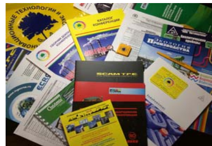
Вложение буклетов в пакеты участников: 1 вложение в каждый пакет: папка с материалами, CD или буклет

Участие в конференции – это возможность познакомиться с новыми технологиями и современным оборудованием, примерами решений различных проблем модернизации промышленных предприятий, возможность найти новых партнеров, заказчиков, проектировщиков и поставщиков.