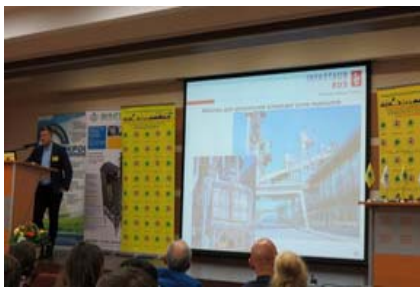
Стенд рядом с трибуной: размещение мобильного стенда типа «Roll up» рядом с трибуной докладчика