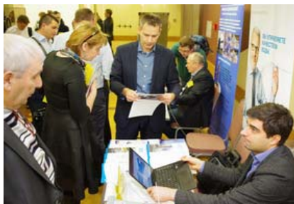
Место для стенда на выставке: место для мобильных стендов, стол и два стула на выставке при конференции (за стендистов оплачивается взнос как за слушателя)